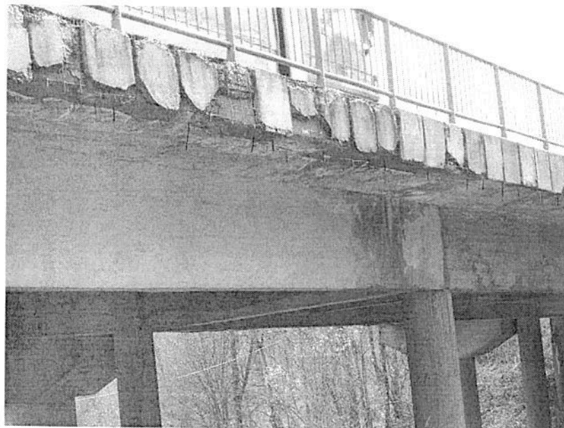
Венци пешачке стазе

Пропао подужни спој старе и нове конструкције. Асфалтни коловозни застор испуцао. На главним носачима старе конструкције отпао местимично заштитни слој тако да је арматура изложена корозији. Такође, и на средњим стубовима на проширењу отпао заштитни слој и арматура кородирала. Ограда на ревизионој стази неадекватна према новим прописима. Венци на ревизионој стази пропали.