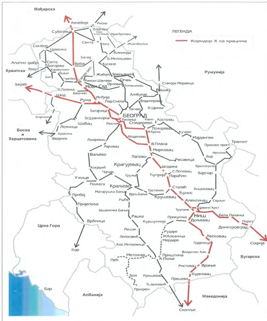
Мрежа јавних железничких пруга Републике Србије:

У извештајном периоду одвијала се интензивна активност у области железничког саобраћаја, како законодавна, тако и у погледу реформи железничког сектора и реализације инфраструктурних развојних пројеката. Свакодневно се пратила реализација, односно спровођење активности на реализацији инфраструктурних пројеката, чија уговорена вредност је око 1.506,7 милијарди евра.