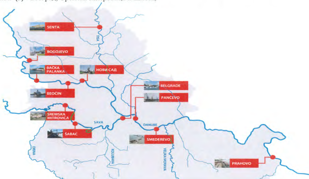
Мапа међународних лука у Републици Србији

Река Сава (3) - Београд, Сремска Митровица и Шабац.