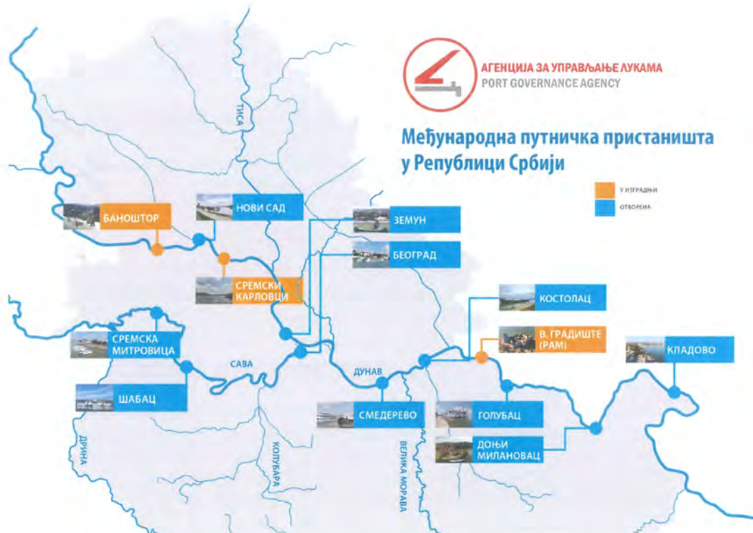
Мапа међународних путничких пристаништа у Републици Србији